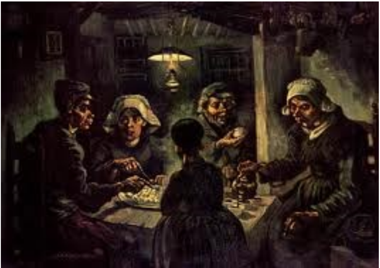
Les mangeurs de pomme de terre - Van Gogh 1885

Ils vivent dans des logements humides et froids, manquent souvent de nourriture et sont victimes de maladies (bronchite, rhumatisme, tuberculose, rachitisme, choléra...). Les conditions de travail dans les usines et les mines sont effroyables, en particulier pour les femmes et les enfants : les journées de travail durent de 12 à 14 heures. Les accidents sont fréquents. Pour toutes ces raisons, l'espérance de vie des ouvriers est faible.