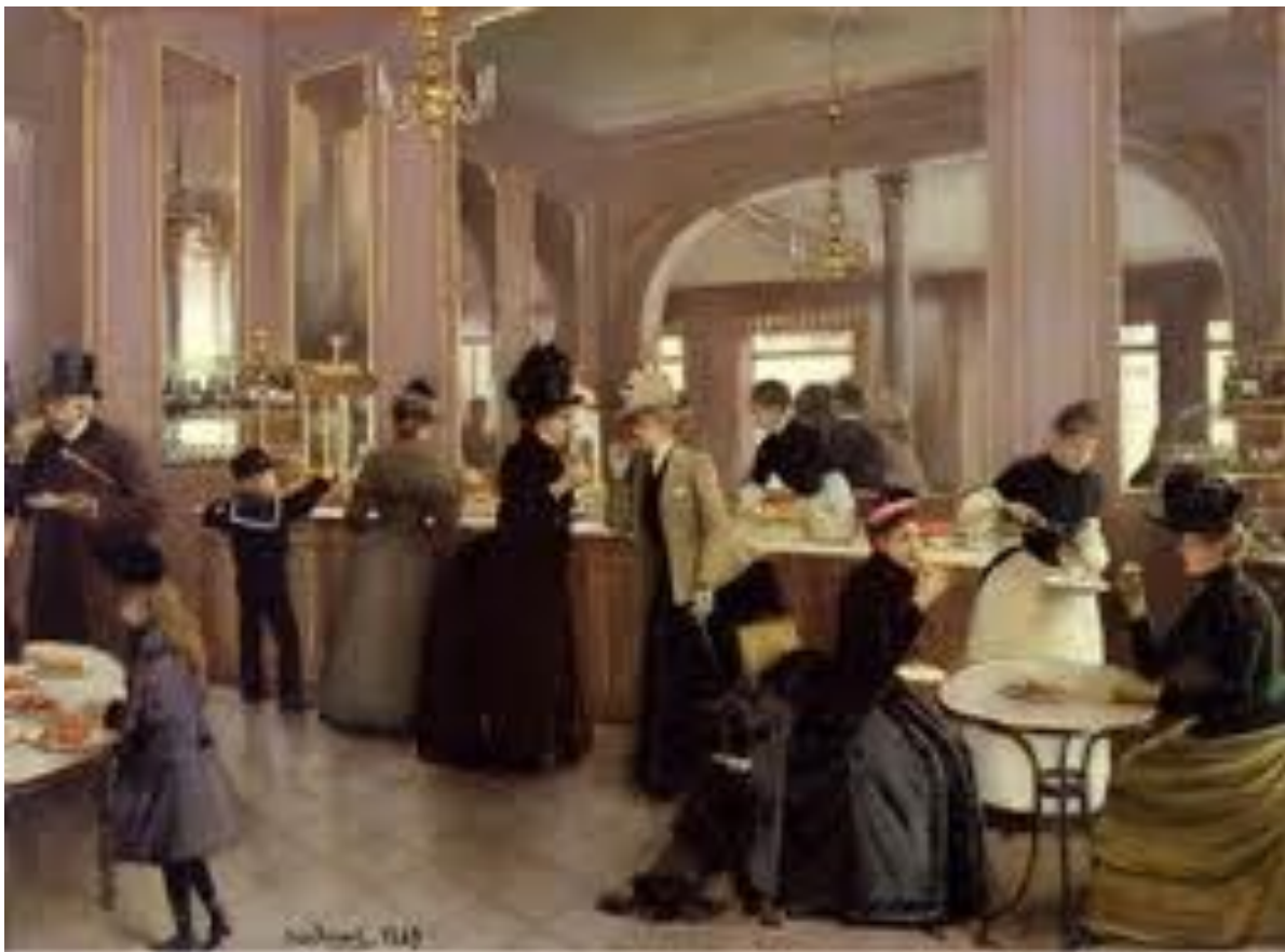
La pâtisserie Gloppe - Jean Béraud 1889